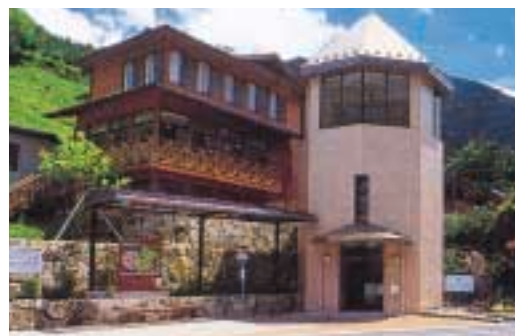
△巖立峡ひめしゃがの湯

当「ひめしゃがの湯」のこだわりとして、お客様に自然を満喫し静かな時間を過ごして頂くと共に素朴な温泉でゆったりとお休みして頂くよう心がけており、館内にはカラオケの設備やBGM放送は行っておりません。更には、これからの寒い季節、湯上がり等に楽しいおしゃべりやのんびりと付近の景色を見てゆっくり休んで頂くために、ロビーでは暖炉に火をおこし皆様をお待ちしています。