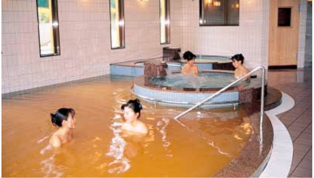
△ひめしゃがの湯内風呂